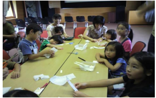
「しおり作り」って楽しいね！

館内の探検の他には、しおり作りや「図書館クイズ」、司書による「おはなし会」など、小さなお子さんでも楽しく過ごして頂ける内容で企画進行された。