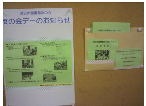
公民館図書館 友の会掲示板