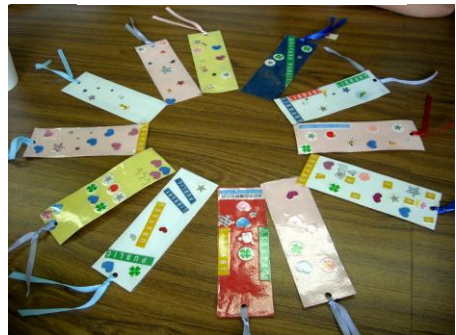
カラフルなしおりの完成！